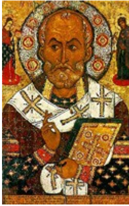
Aleksa Petrov: Russische Ikone, 1294

Verbreitete Legenden über Nikolaus erzählen vom Geldgeschenk, das er heimlich durchs Fenster und durch den Kamin in die darin aufgehängten Socken warf um zu verhindern, dass der Vater seine Töchter zur Prostitution hergeben musste. Drei zu Unrecht zum Tod Verurteilte konnte er retten, indem er im Traum dem Kaiser erschien und um ihre Befreiung bat; in anderer Version rettete er sie, indem er das Schwert des Henkers abwehrend ergriff. Um ein in Seenot geratenes Schiff zu retten mit drei Pilgern, die von Ephesus ausfuhren und das für eine christliche Kapelle bestimmte heilige Öl in den Diana-Tempel zurückbringen sollten, begab er sich an Bord, stillte den Sturm und brachte das Schiff sicher in den Hafen. *