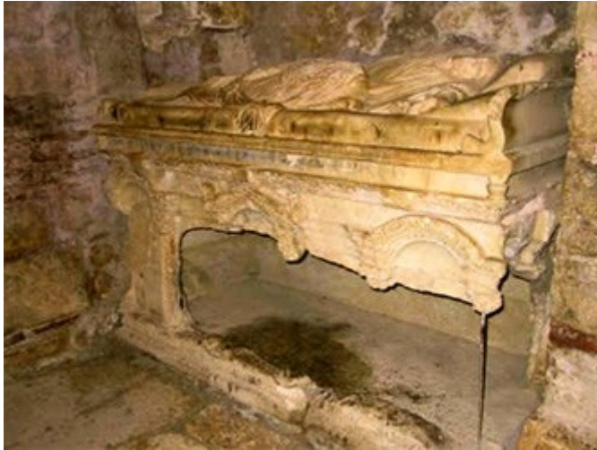
Nikolaus-Grab in Demre

Die Ruine einer frühmittelalterlichen Basilika bei Demre erinnert heute an das erste Grab von Nikolaus.