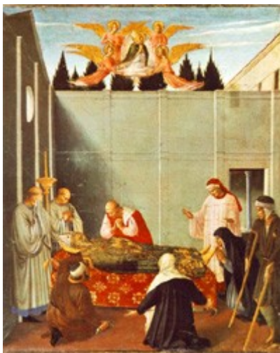
Fra Angelico: Der Tod des Nikolaus, Altarbild in Perugia, 1437, heute in der Pinacothek im Vatikan

Der bekannte Brauch der Befragung der Kinder durch den Nikolaus, ob sie denn auch brav und fromm gewesen seien, geht auf diese Praxis zurück. Ursprünglich war der Nikolaustag der Tag der grossen Bescherung mit Geschenken - in einigen Ländern ist er dies heute noch.