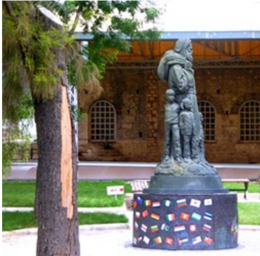
Nikolaus-Denkmal in Demre

Patron von Russland, Lothringen; von Amsterdam, Kanton und Stadt Fribourg in der Schweiz, Meran, Bari, Trani in Apulien und New York; der Kinder, der Schüler, Mädchen, Jungfrauen, Frauen mit Kinderwunsch, Gebärenden und alten Menschen, der Ministranten, Feuerwehr, der Pilger und Reisenden; der Sinti und Roma (Zigeuner), der Gefangenen, Diebe und Verbrecher, der Eigentümer und Bettler; der Seeleute, Schiffer, Fischer, Flösser, Schiffsbauer, Matrosen und Fährlleute, der Kaufleute, Bankiers, Pfandleiher; der Richter, Rechtsanwälte und Notare, der Apotheker, Bauern, Bäcker, Müller, Korn- und Samenhändler, Metzger, Bierbrauer, Schnapsbrenner, Wirte, Weinhändler, Fassbinder, Parfümhersteller und -händler, Schneider, Weber, Spitzen- und Tuchhändler, Knopfmacher, Brückenbauer, Steinmetze, Steinbrucharbeiter, Kerzenzieher; für glückliche Heirat und Wiedererlangung gestohlener Gegenstände; gegen Wassergefahren, Seenot und Diebe; (zweiter) Patron des Bistums Lausanne-Genf-Fribourg.