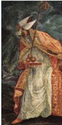
Tintoretto (1518 - 1594), im Kunsthistorischen Museum in Wien

Kirche errichtet wurde; sie wurde ein bedeutendes Wallfahrtsziel. Zwischen dem 11. bis zum 16. Jahrhundert wurden diesseits der Alpen mehr als 2200 Kirchen nach Nikolaus benannt.