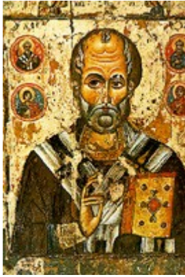
Russische Ikone, Mitte des 13. Jahrhunderts

Schiffchensetzen nennt man den seit dem 15. Jahrhundert bekannten Brauch, bei dem Nikolausschiffe aus Papier gebastelt werden, in die Nikolaus seine Gaben legen soll - Hintergrund für diesen Brauch dürfte sein Patronat für Schiffer sein - auch heute noch findet sich auf vielen Handelsschiffen ein Bildnis von Nikolaus. Das Nikolausschiffchen wurden später durch Stiefel, Schuhe oder Strümpfe abgelöst, die am Nikolausabend von den Kindern vor die Tür gestellt werden und die über Nacht von ihm mit Süßigkeiten gefüllt werden; dieser Brauch basiert auf der Legende von den drei Jungfrauen, die nachts von Bischof Nikolaus beschenkt wurden.